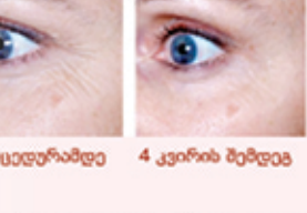
პროცედურამდე 4 კვირის შემდეგ

თუ ხართ 30 წელს გადაცილებული Face FX იდეალური აპარატია, რომელიც ინფრანითელი ლაზერის სხივის საშუალებით უზრუნველყოფს კანის ხიზბილეს, ერთგვაროვნებას და დაიყვანს მას ნაოჭების წარმოქმნისგან. ისრაელში წარმოებული კომპანია Silk'1-ის გაახალგაზრდავებელი აპარატი Face FX-სი აგელოგების სახისა და კისრის არიდან ახაკობრივი და მიმიკურ ნაოჭებს. ფეის ეფ ექსი იყენებს Home Fractional (HF) ტექნოლოგიას, რითაც ქმნის ღრმად დანაწევრებული წითელი სხივისა და კანის სამკურნალო თბერ-ხინერგიულ კომბინაციას, რაც განაპირობებს თქვენი კანის ხავერდოვნებას.